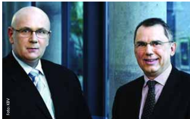
Die beiden KBV-Vorstände betonen: Die Honorarreform 2009 ist Ansporn und Ausgangspunkt für weitere Verbesserungen.

Das Vergütungsniveau Ost wird auf rund 95 Prozent des Niveaus West angehoben. Die Trennung der Honorartöpfe für Haus- und Fachärzte bleibt erhalten, so dass hier keine Verlagerungseffekte zum Nachteil einer Gruppe stattfinden. Das Budget im klassischen Sinne ist abgeschafft. Erstmals seit 20 Jahren stehen wieder Beträge in Euro und Cent im EBM, keine Punkte. Die Preise sind vielleicht noch nicht restlos zufriedenstellend. Aber sie sind ein erster wichtiger