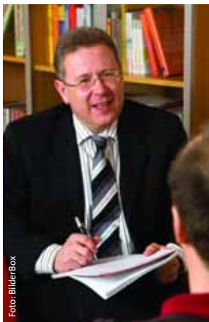
Psychotherapeuten: neue Zeitgrenzen

Grundsätzlich zerstreuen die KBV-Honorarexperten Sorgen wegen der Regelleistungsvolumen: Wer eine durchschnittliche Praxis führe, werde damit gut hinkommen. Auch die Befürchtung, mit dem RLV sei nicht auszukommen, ist in den meisten Fällen unbegründet. Denn generell sind sie so konstruiert, dass Zuwächse erst abgestaffelt werden, wenn ein Arzt die durchschnittliche Fallzahl seiner Arztgruppe um mehr als 150 Prozent überschritten hat. Außerdem hat nicht jede Abweichung negative Folgen fürs RLV. Berücksichtigt werden unter anderem urlaubs- und krankheitsbedingte Vertretungen von Kollegen. Ärzte können zudem Praxisbesonderheiten geltend machen.