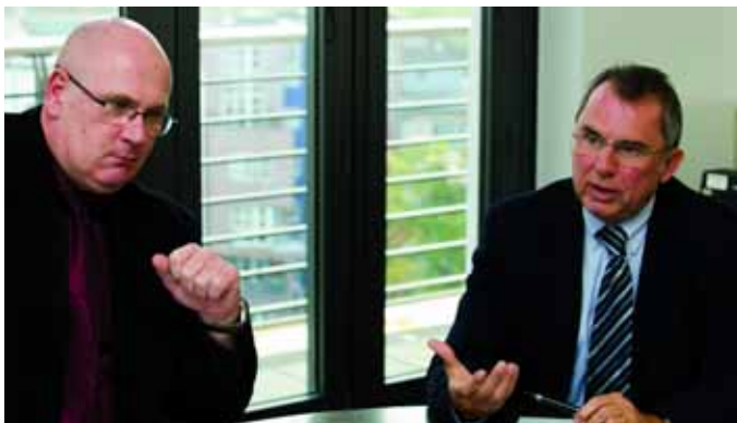
Der KBV-Vorstand: Nun gibt es gleiches Geld für gleiche Leistung. Und die Honorare im Osten werden endlich an das Westniveau angeglichen.

Müller: Es war uns sehr wichtig, das Honorar der Ärzte in den neuen Bundesländern anzupassen. Das ist uns gelungen, ebenso die Sicherung förderungswürdiger und präventiver Leistungen. Und die Gesamtvergütung ist um zehn Prozent gestiegen.